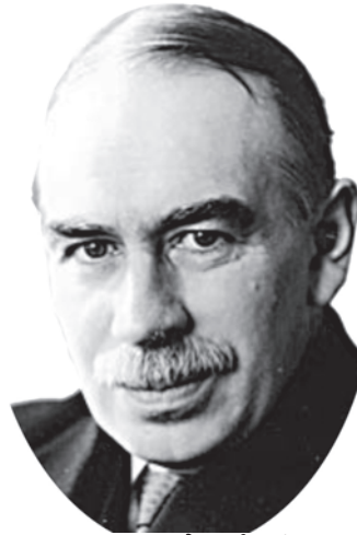
जॉन मेनार्ड कीन्स

ब्रिटिश अर्थशास्त्री जॉन मेनार्ड कीन्स का जन्म 1883 में हुआ था। उनकी शिक्षा किंग्स कॉलेज, कैंब्रिज यूनाइटेड किंगडम में हुई थी और बाद में 'विशेषज्ञ' के रूप में नियुक्त हुए। प्रथम विश्व युद्ध के वर्षों में वे तीक्ष्ण विद्वता के अलावा सक्रिय अंतर्राष्ट्रीय राजनायिक के रूप में भी जुड़े रहे। अपनी पुस्तक 'इकोनॉमिक कंसीक्वेंसेज ऑफ द पीस' (1919) में युद्ध की शांति समझौते के भंग होने की भविष्याणी इन्होंने कर दी थी। उनकी पुस्तक 'जनरल थ्योरी ऑफ इंफ्लायमेंट, इंटरेस्ट एंड मनी' (1936) बीसवीं सदी की अर्थशास्त्र की महत्वपूर्ण पुस्तकों में से एक है। कीन्स विदेशी मुद्रा के समझदार सट्टेबाज थे।