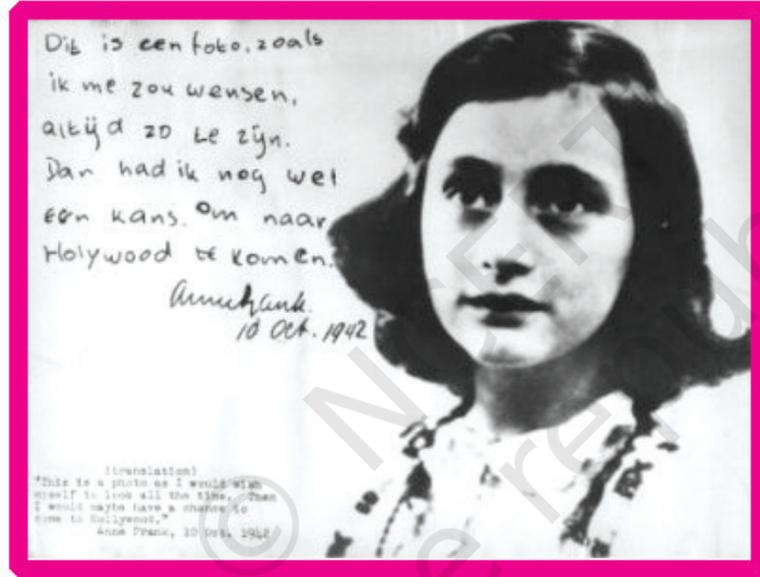
ऐन फ्रैंक की डायरी का एक पन्ना

मेरी प्यारी किट्टी, अब मैं तुम्हें कितना उलझा रही हूँ। लेकिन मैं चीज़ें एक बार लिखकर उन्हें काटना पसंद नहीं करती