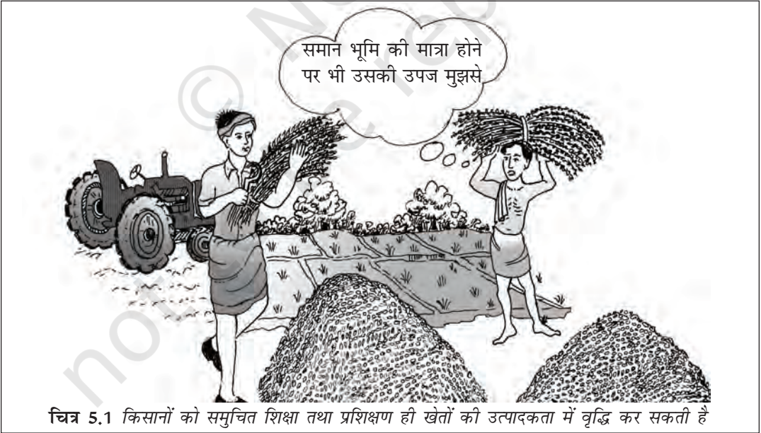
चित्र 5.1 किसानों को समुचित शिक्षा तथा प्रशिक्षण ही खेतों की उत्पादकता में वृद्धि कर सकती है

आर्थिक समृद्धि में उसका योगदान क्रमशः अधिक होता है। शिक्षा पाने का प्रयास केवल उपार्जन क्षमता बढ़ाने के लिए नहीं किया जाता बल्कि उसके और भी अधिक मूल्यवान लाभ हैं। शिक्षा लोगों को उच्चतम सामाजिक स्थिति और गौरव प्रदान करती है। यह किसी व्यक्ति को अपने जीवन में बेहतर विकल्पों का चयन कर पाने के योग्य बनाता है, व्यक्ति को समाज में चल रहे परिवर्तनों की बेहतर समझ प्रदान करता है और नव परिवर्तनों को बढ़ावा देता है। शिक्षित श्रम शक्ति की उपलब्धता नयी प्रौद्योगिकी को अपनाने में भी सहायक होती है। देश शिक्षा के अवसरों