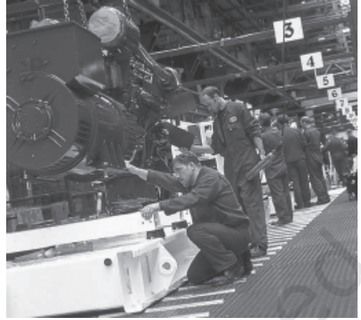
चित्र 5.3 वैज्ञानिक और तकनीकी जन-शक्ति: मानव पूँजी का एक मुख्य घटक है

मानव पूँजी की वृद्धि के कारण आर्थिक संवृद्धि होती है। इसे सिद्ध करने के लिए व्यावहारिक साक्ष्य अभी स्पष्ट नहीं हैं। इसका कारण मापन की समस्याएँ हो सकती हैं। उदाहरण के लिए, स्कूली वर्षों की गणना, शिक्षक-शिक्षार्थी अनुपात और नामांकन दर आदि के आधार पर शिक्षा का मापन उसकी गुणवत्ता को आर्थिक रूप से व्यक्त नहीं कर पाता। इसी प्रकार स्वास्थ्य सेवाओं पर मौद्रिक व्यय, जीवन प्रत्याशा तथा मृत्यु दरों आदि से देश की जनसंख्या के वास्तविक स्वास्थ्य स्तर का सही ज्ञान नहीं होता। यदि इन सूचकों का प्रयोग कर विकसित तथा विकासशील देशों में शिक्षा व स्वास्थ्य स्तरों और प्रतिव्यक्ति आय में सुधारों की तुलना करें तो हमें मानव पूँजी के परिवर्तनों में साहचर्य दिखायी पड़ता है, किंतु प्रतिव्यक्ति वास्तविक आय में ऐसी कोई प्रवृत्ति स्पष्ट नहीं होती। दूसरे