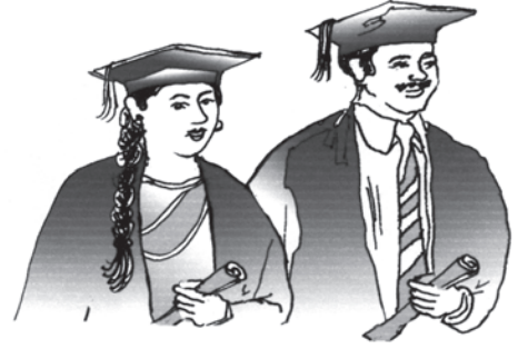
चित्र 5.7 उच्च शिक्षा: कम प्राप्तकर्ता

उच्च शिक्षा-लेने वालों की कमी: भारत में शिक्षा का पिरामिड बहुत ही नुकीला है, जो दर्शाता है कि उच्चतर शिक्षा स्तर तक बहुत