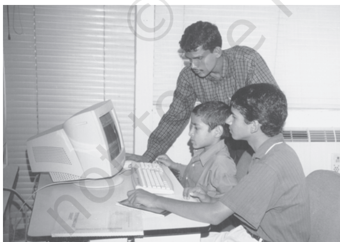
चित्र 5.4 आगे का काम: भारत को ज्ञान अर्थव्यवस्था में परिवर्तित करना

विश्व बैंक ने अपनी एक ताजा रिपोर्ट ‘भारत और ज्ञान