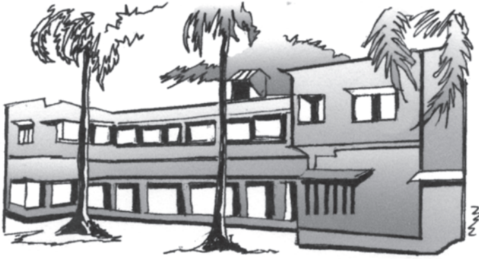
चित्र 5.5 शैक्षिक आधारिक संरचनाओं में निवेश अपरिहार्य

के शैक्षिक व्यय को शामिल कर लें तो शिक्षा पर कुल व्यय और अधिक होना चाहिए। कुल शिक्षा व्यय का एक बहुत बड़ा हिस्सा प्राथमिक शिक्षा पर खर्च होता है। उच्चतर/तृतीयक शैक्षिक संस्थाओं (उच्च शिक्षा के संस्थानों जैसे-महाविद्यालयों, बहुतकनीकी संस्थानों और विश्वविद्यालयों आदि) पर होने वाला व्यय सबसे कम है। यद्यपि औसत रूप से सरकार उच्चतर शिक्षा पर बहुत कम व्यय करती है, किंतु प्रति विद्यार्थी उच्चतर शिक्षा पर व्यय प्राथमिक शिक्षा की तुलना में अधिक है। इसका, अर्थ यह नहीं है कि वित्तीय संसाधनों को उच्चतर शिक्षा से प्राथमिक शिक्षा की ओर कर दिया जाना चाहिए।