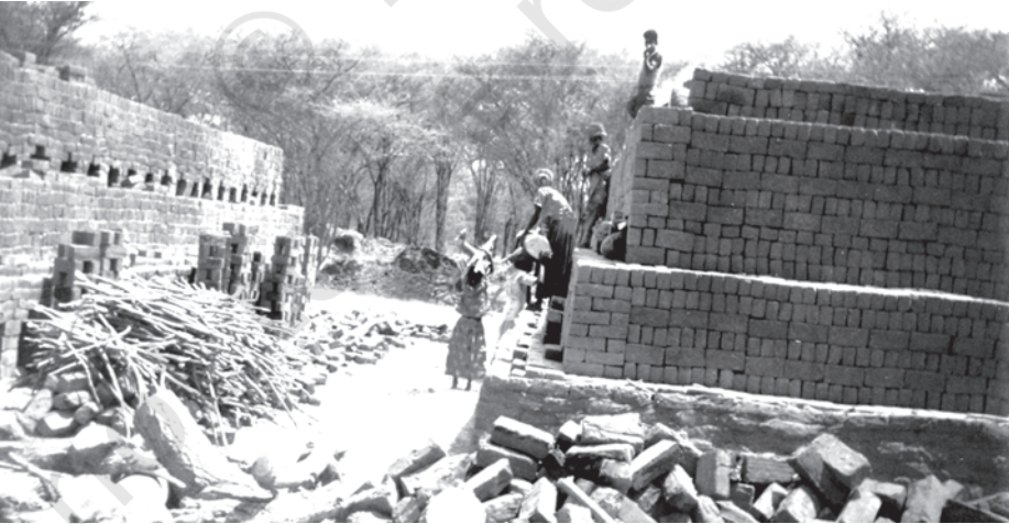
चित्र 5.6 विद्यालय छोड़ने वाले छात्र बाल श्रम को बढ़ावा देते हैं जिससे मानव पूँजी का क्षय होता है

कम लोग पहुँच पाते हैं। यही नहीं, शिक्षित युवाओं की बेरोजगारी दर भी उच्चतम है। राष्ट्रीय प्रतिदर्श सर्वेक्षण संगठन के आंकड़ों के अनुसार, वर्ष 2011-12 में ग्रामीण क्षेत्रों में स्नातक व ऊपर अध्ययन किया हो युवा पुरुषों के बीच बेरोजगारी दर 19 प्रतिशत थी। उनके शहरी समकक्षों में 16 प्रतिशत अपेक्षाकृत कम स्तर पर बेरोजगारी दर थी। सबसे गंभीर रूप से प्रभावित लोगों में लगभग 30 प्रतिशत बेरोजगार हैं जो युवा ग्रामीण महिला थीं। इसके