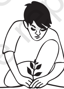
पेड़-पौधों की देखभाल