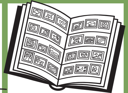
डाक-टिकट इकट्ठे करना