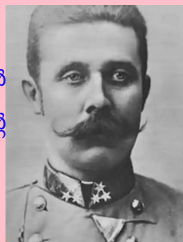
ആർച്ച് ഡ്യൂക്ക് ഫ്രാൻസിസ് ഫെർഡിനാന്റ്

സൂചന: മൊറോക്കൻ പ്രതിസന്ധി, ബാൾക്കൻ പ്രതിസന്ധി, ഫ്രാൻസിസ് ഫെർഡിനാന്റിന്റെ കൊലപാതകം.