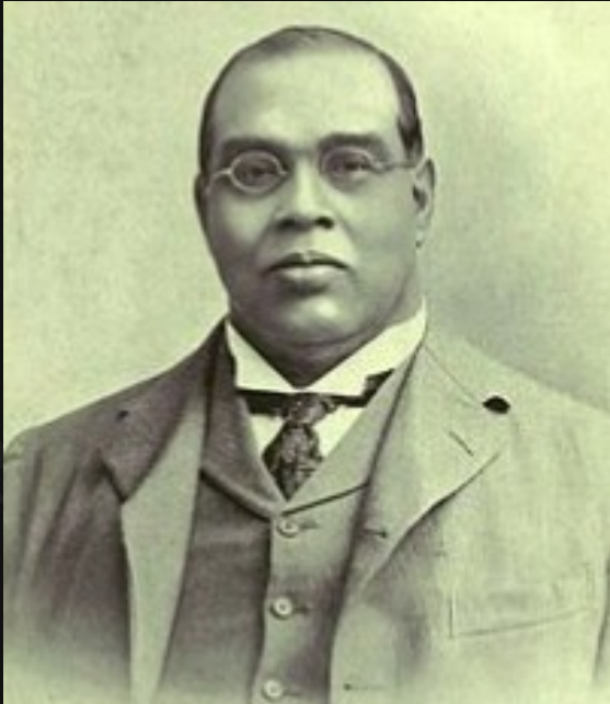
രമേശ് ചന്ദ്ര ദത്ത്

ബ്രിട്ടീഷ് ചൂഷണങ്ങളെങ്ങനെ ഇന്ത്യയെ ദരിദ്രമാക്കുന്നു എന്ന് ജനങ്ങൾക്കിടയിൽ തുറന്ന് കാട്ടിയ നേതാക്കന്മാർ?