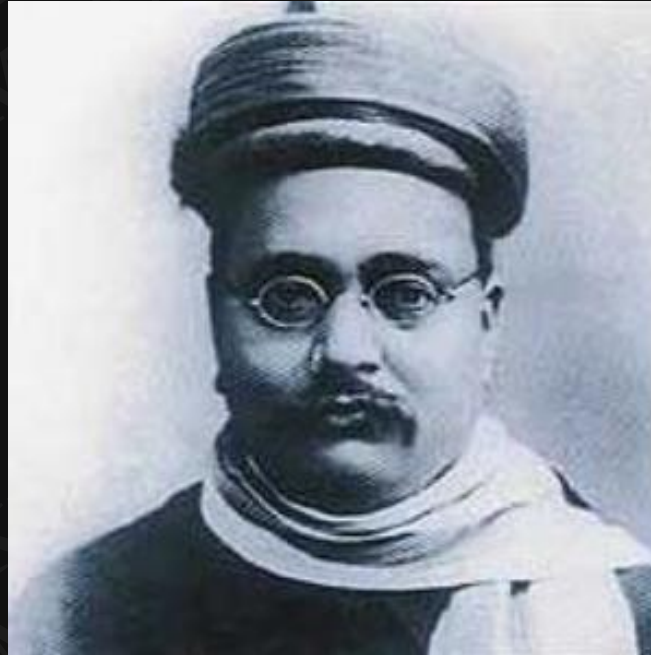
ഗോപാല കൃഷ്ണ ഗോഖലെ