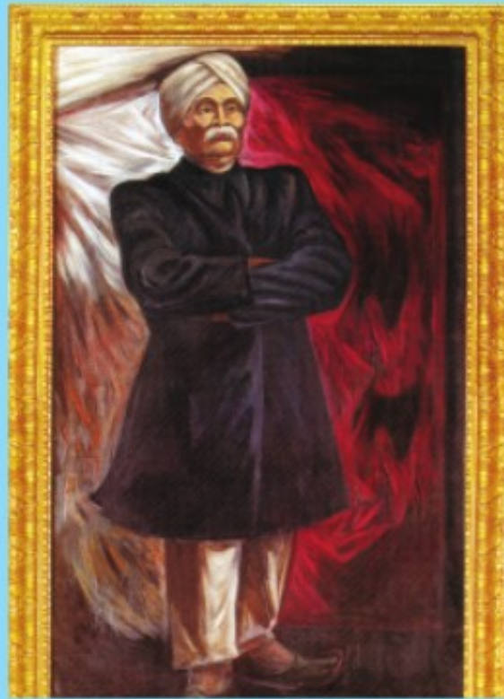
ലാലാ ലജ്പത് റായ്