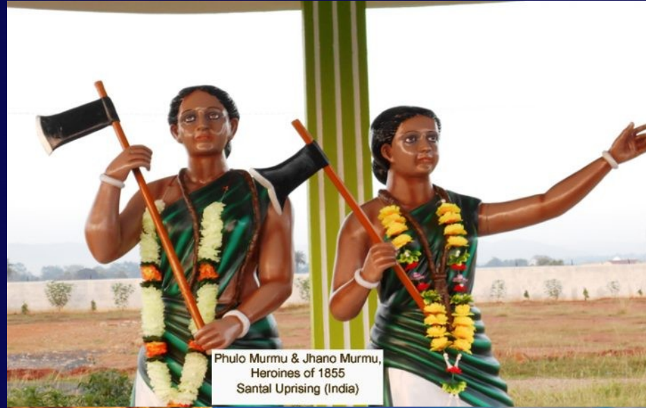
Phulo Murmu & Jhano Murmu, Heroines of 1855 Santal Uprising (India)