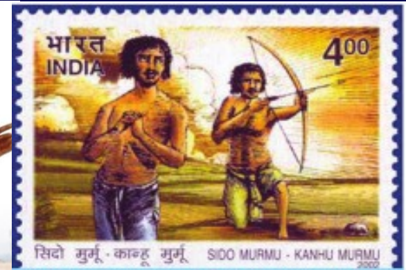
सिदो मुर्मू - कन्हू मुर्मू SIDO MURMU - KANHU MURMU സന്താൾ കലാപത്തിന് നേതൃത്വം നൽകിയ സിദ്ദുവിനെയും കാനുവിനെയും ആദരിച്ചുകൊണ്ട് ഇന്ത്യ ഗവൺമെന്റ് പുറത്തിറക്കിയ സ്റ്റാമ്പ്.