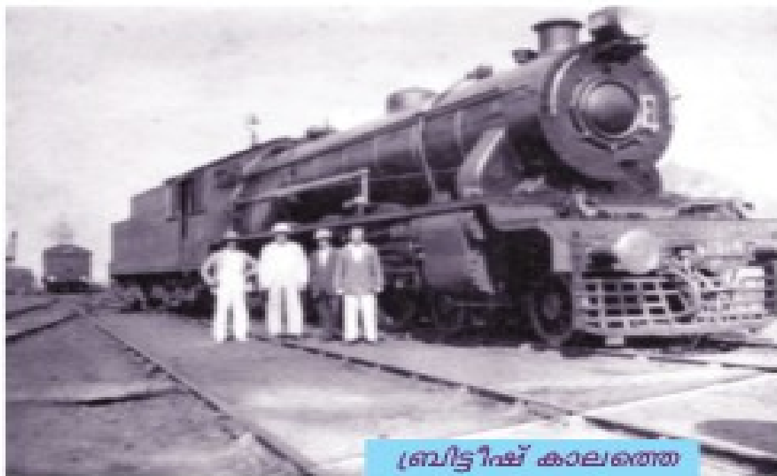
ബ്രിട്ടീഷ് കാലത്തെ തീവണ്ടി