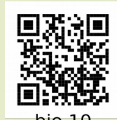
bio 10 class35

1.ചികിത്സയാണ് അവസാനത്തെ പ്രതിരോധം. വിവിധചികിത്സാരീതികൾ താഴെ കൊടുത്തിരിക്കുന്നു. ഉദാഹരണത്തിലേതുപോലെ പട്ടിക പൂരിപ്പിക്കുക..