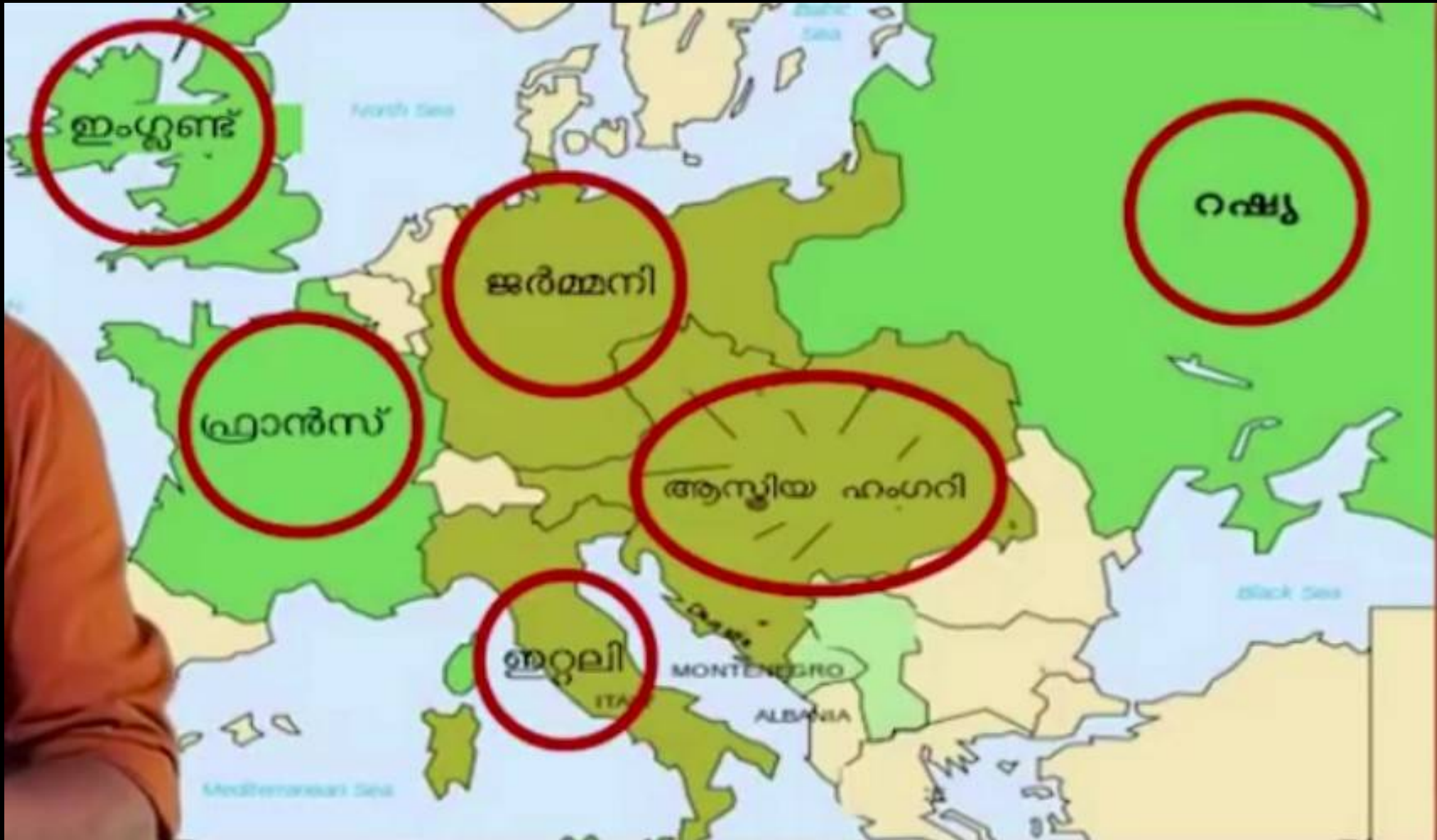
BIJU KK, HST SOCIAL SCIENCE GHSS TUVVUR, 2021-22