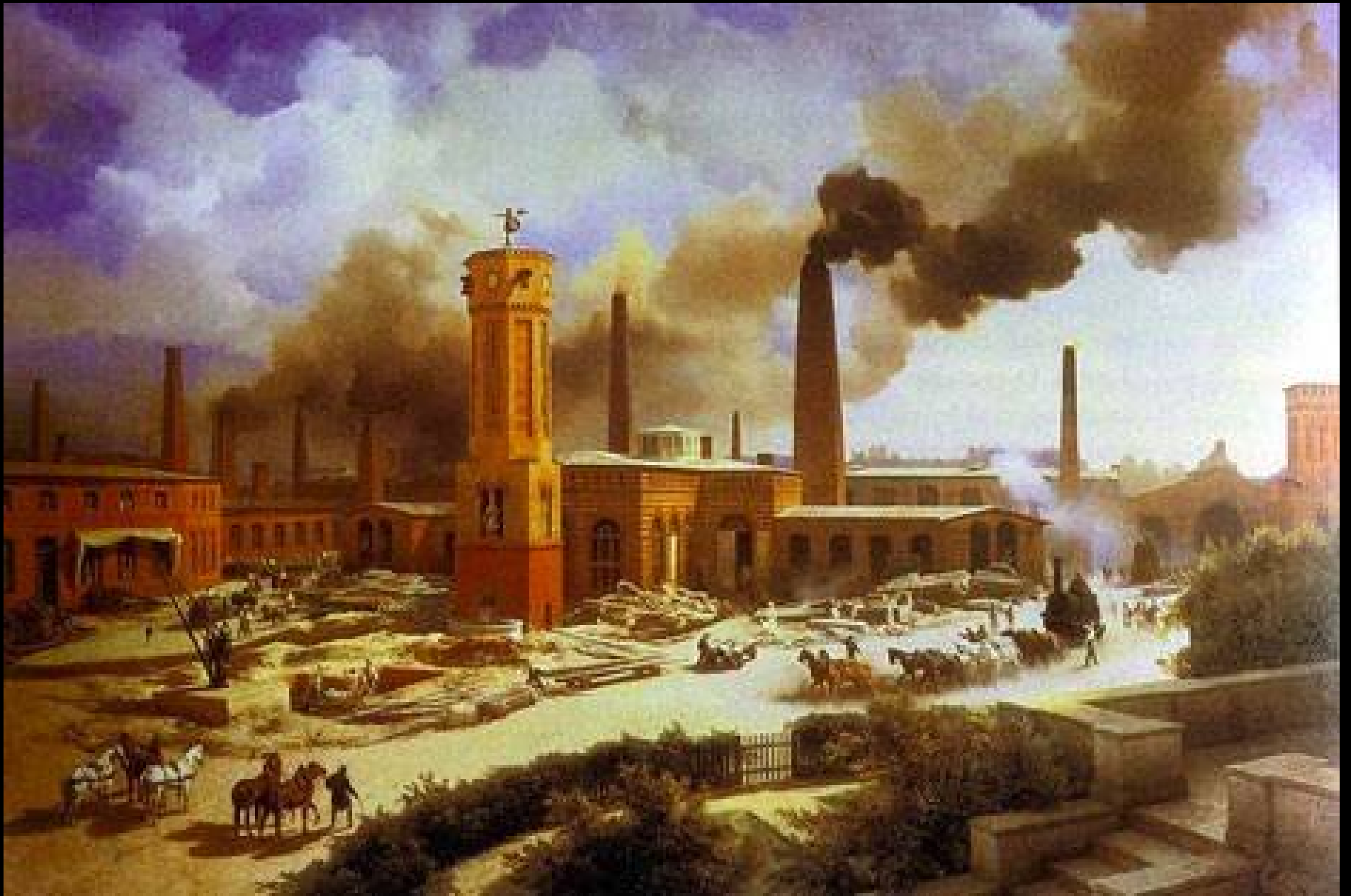
BIJU KK, HST SOCIAL SCIENCE GHSS TUVVUR, 2021-22