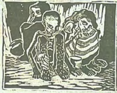
ചിത്രം - ചിത്രപ്രസാദിന്റെ ക്ഷാമകാലചിത്രം

8. താഴെ കൊടുത്തിരിക്കുന്നവയിൽ നിന്നും ഏതെങ്കിലും 3 താളവാദ്യങ്ങളുടെ പേരെഴുതുക. (ചെണ്ട, വയലിൻ, തബല, വീണ, ഇടയ്ക്ക)