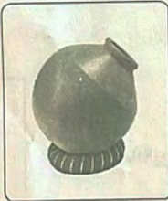
(ഇലത്താളം, തബല, ഘടം, മൃദംഗം.)