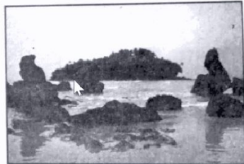
ഭൂരുപം - ബി) ..... രൂപീകരണ സഹായി - തിരമാല