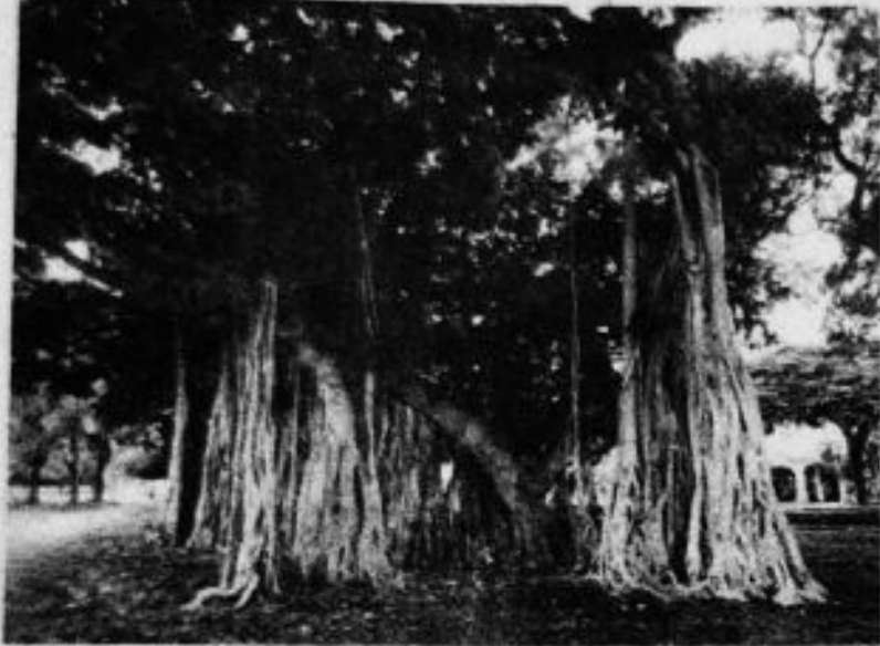
ചിത്രം - 1