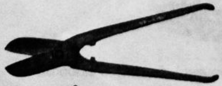
ചിത്രം - 1

എ) അപ്പൂവിന് തന്റെ റോസാച്ചെടിയിൽ നിന്നും ഒരു കൊമ്പ് മുറിച്ചെടുക്കേണ്ടതുണ്ട്. താഴെ കൊടുത്തിരിക്കുന്നതിൽ ഏത് കൃത്രിക ഉപയോഗിച്ചാലാണ് എളുപ്പത്തിൽ കൊമ്പ് മുറിക്കാൻ കഴിയുന്നത്? എന്തുകൊണ്ട്?