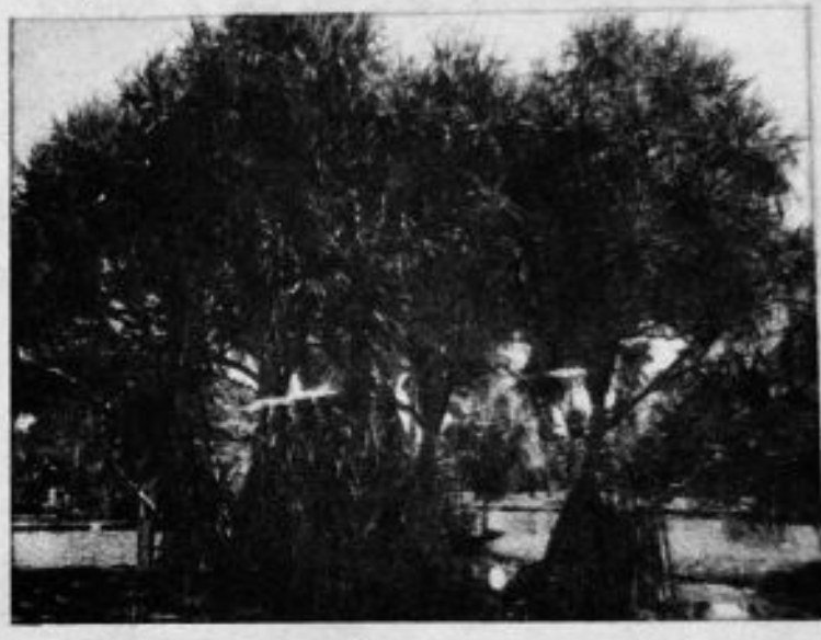
ചിത്രം - 2

എ) ചിത്രത്തിലെ സസ്യങ്ങളെയും വേരുകളെയും തിരിച്ചറിഞ്ഞ് അവയുടെ പേരെഴുതുക.