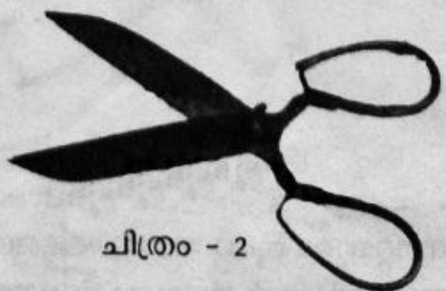
ചിത്രം - 2

ബി) ധാരത്തിനും യത്നത്തിനും ഇടയിൽ രോധം വരുന്ന ഏതെങ്കിലും രണ്ട് ഉപകരണങ്ങളുടെ പേരെഴുതുക.