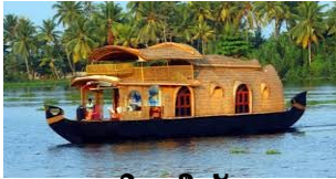
വഞ്ചി വീട് (ഹൗസ് ബോട്ട്)