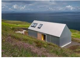
ടിൻ ഷീറ്റ് വീട്